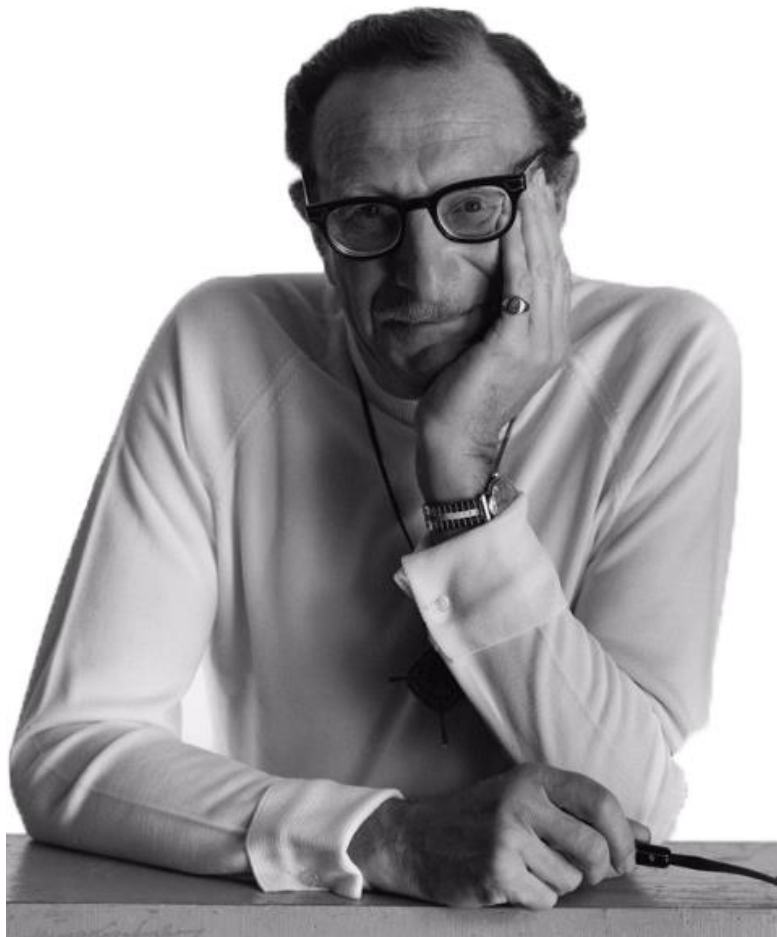
DR. ERIC BERNE (1910-1970)